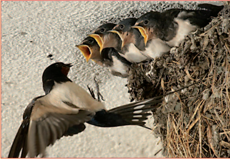
Σκίζω ρίζω το λεμόνι βρίσκω την Πανάγιω μέσα (δημοτικό Ηπείρου)