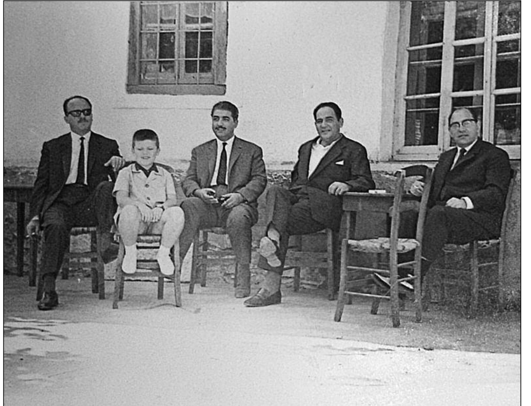
Στο καφενείο και αρτοποιείο του Θεόδωρου Παπαζήκου.