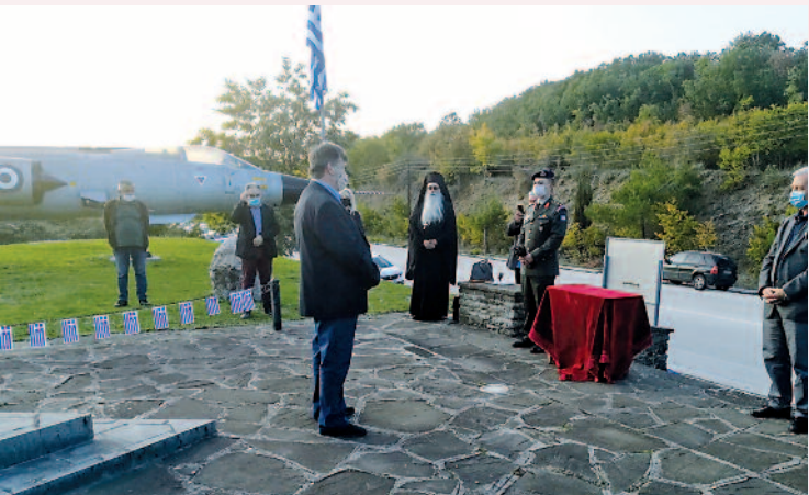
Με λιτό μνημόσυνο στην έδρα του ηρωικού Ανεξαρτήτου Τάγματος Δελβινακίου τιμήθηκε και φέτος η μνήμη των πεσόντων.