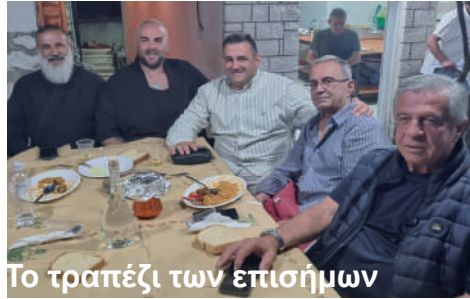
Το τραπέζι των επισήμων

ΣΑΒΒΑΤΟ 16 ΑΥΓΟΥΣΤΟΥ: Το πρωί τελέστηκε Θεία Λειτουργία και αρτοκλασία στον Άγιο Δημήτριο. Το βράδυ ήρθε η μεγάλη στιγμή: το πανηγύρι του χωριού. Σερβιρίστηκε παραδοσιακός κοφτός, ενώ ακολούθησε γλέντι με ζωντανή μουσική, τραγούδι και χορό μέχρι αργά.