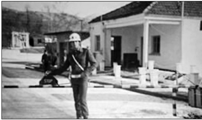
Οι μπάρες στα Πομακοχώρια

Ο κορυφαίος Έλληνας μετεωρολόγος Δημήτρης Ζιακόπουλος, ο οποίος κατάγεται από την Κόνιτσα, μας είπε: «Πηγαίνοντας προς την Κόνιτσα, ο έλεγχος γινόταν στο Καλπάκι. Οι μόνιμοι κάτοικοι της επαρχίας μας ήταν εφοδιασμένοι με ένα λευκό δίπτυχο (ταυτότητα) και περνούσαν με την επιδειξή του. Όσοι επισκέπτονταν για διάφορους λόγους την Κόνιτσα και τα χωριά της, για να περάσουν από το Καλπάκι, έπρεπε να είναι εφοδιασμένοι με ειδική άδεια που εξέδιδε η Ασφάλεια Ιωαννίνων. Εκεί, για να πάρεις τη συγκεκριμένη άδεια, έπρεπε να δηλώσεις τους λόγους για τους οποίους ήθελες να επισκεφθείς την περιοχή».