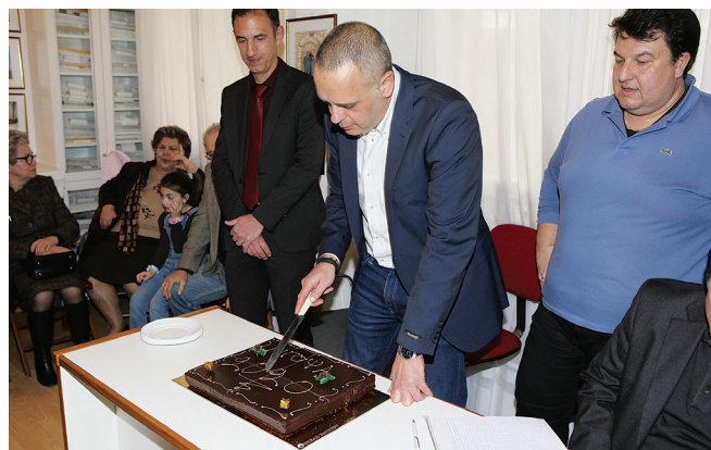
Ο Πρόεδρος Δ. Πίνας κόβει την πρωτοχρονιάτικη πίτα

Με την ευχή όλων για καλή δύναμη και επιτυχία, φυσικά με την βοήθεια όλων μας, στο έργο που αναλαμβάνει