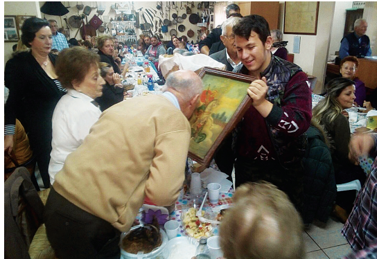
Από το γλέντι του Αγίου Μηνά

(Κοντοχωριανοί και φίλοι από τις Βατατάδες, αρκετοί από τους οποίους, είναι λήπτες και τακτικοί συνδρομητές τις εφημερίδας μας, την οποία και αγαπούν, μας έστειλαν να δημοσιεύσουμε το παρακάτω κείμενο, με στοιχεία του χωριού τους, το οποίο με μεγάλη μας χαρά το δημοσιεύουμε. Με τους Βαταταδίτες μας συνδέουν πολλά, γι' αυτό και πάντα τους τιμούμε και μας τιμούν στις διάφορες εκδηλώσεις.)