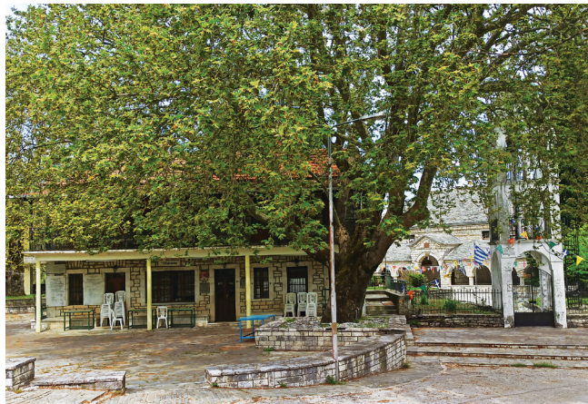
Ο κορονοϊός νέκρωσε και την όμορφη πλατεία του χωριού μας.

Ο νέος ιός, δεν γνωρίζουμε από πού προήλθε. Δεν αποκλείεται να είναι αποτέλεσμα ενός πειραματικού ατυχήματος ή το πιθανότερο από την πλανητική οικολογική αναταραχή. Η αλόγιστη καταστροφή των οικοσυστημάτων, των βιότοπων, των δασών κ.λ.π. έφερε το πιο πιθανόν τον κορονοϊό στο σπίτι μας. Αρκετές ασθένειες και στο παρελθόν προήλθαν από πουλιά και ζώα. Κινέζος δημοσιογράφος χαρακτήρισε την επιδημία του κορονοϊού «εκδίκηση των παγκολίνων», ένα ζώο (μυρμηγκοφάγος) που κόλλησε τον ιό πιθανόν από