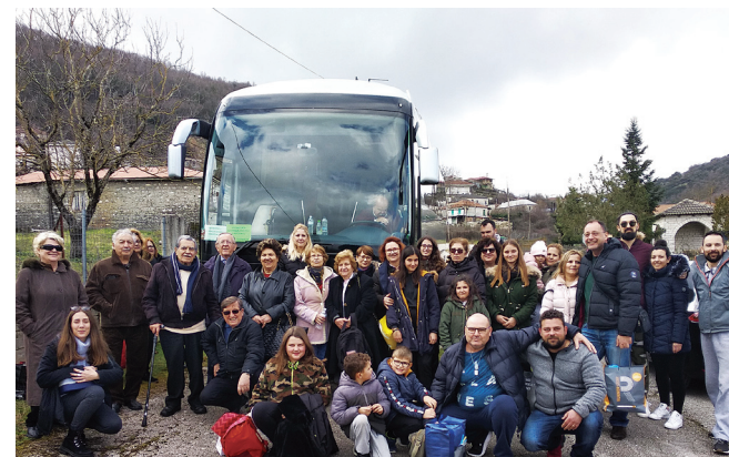
Οι εκδρομείς στη Ράχη του χωριού