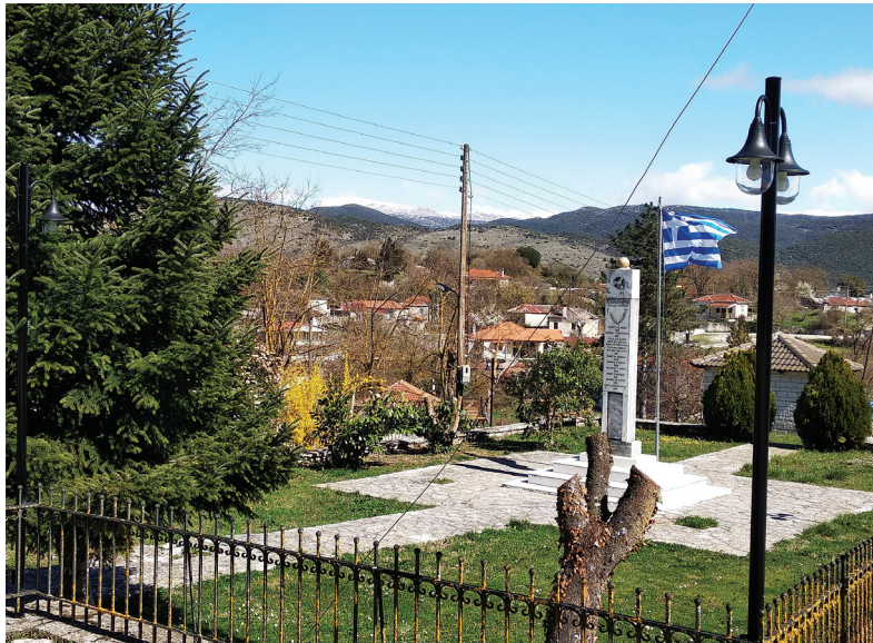
Το Ηρώο του χωριού με τον νέο ηλεκτροφωτισμό.

ΗΡΩΟ ΠΕΣΟΝΤΩΝ: Τοποθετήθηκαν 15 διπλά φωτιστικά σώματα περιμετρικά του χώρου, έγινε δοκιμή στον