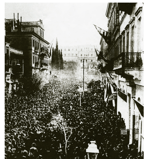
Οι Γιαννιώτες γιορτάζουν στην πλατεία, την απελευθέρωση της πόλης (21.2.1913)