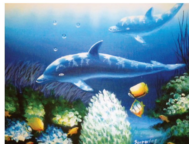
Κόσμος του Βυθού, από την ιδιόχειρη Συλλογή του Σωκράτη Τζιάφου. (Λάδια σε μουσαμά, διαστάσεις 1,2 x 0,80)