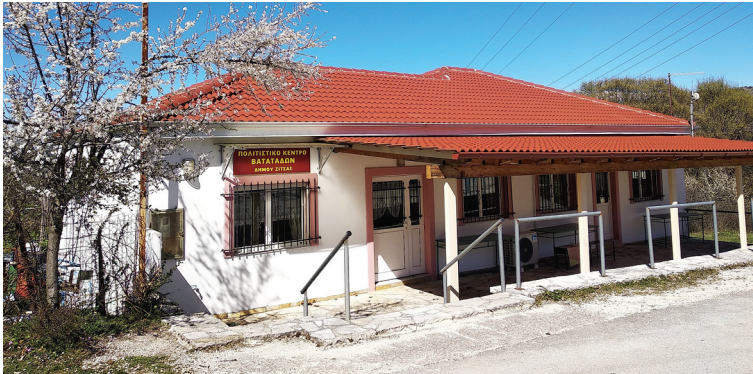
Πνευματικό Κέντρο Βατατάδων