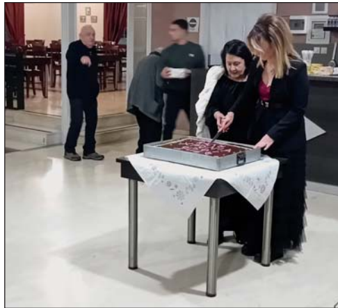
Το ΚΑΠΗ στις 30 Ιανουαρίου έκοψε στην Καλλιθέα την πρωτοχρονιάτικη πίτα του.

Τον Ιανουάριο που μας πέρασε οι βασιλόπιτες είχαν την τιμητική τους. Φορείς και σύλλογοι του χωριού μας έκοψαν την βασιλόπιτα, όπως δείχνουν και φωτογραφίες.