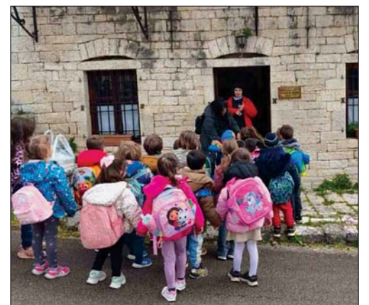
Από την ξενάγηση του 7ου νηπιαγωγείου Ιωαννίνων στις 19/3.