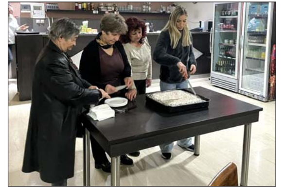
Ο Σύλλογος Γυναικών έκοψε την πίτα του στην Καλλιθέα.