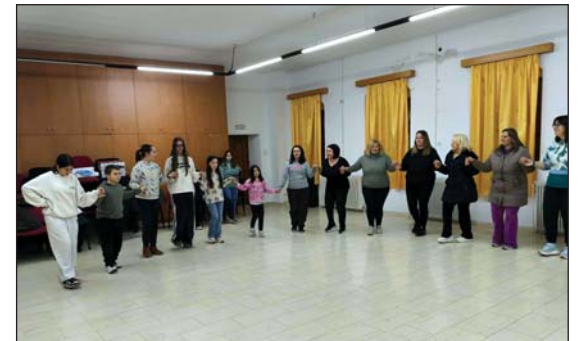
Τα χορευτικά τμήματα του Πολιτιστικού Συλλόγου έκοψαν τη δική τους πίτα.